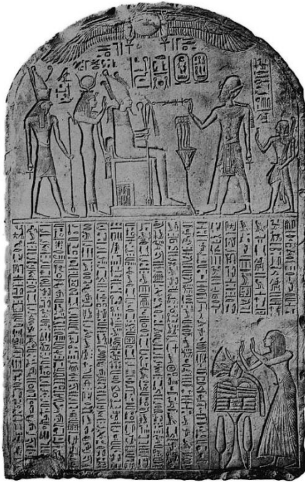
Рис. 2. Stele Brüssel MRAH E. 5300 (9) [26, pl. IV]