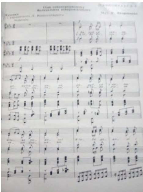
Рис. 4. Перша сторінка нотного тексту "Гімну новонародженому" (музика В. Філіпенка, слова В. Луценка) [8]

вості, яка за законами суспільно-культурної спадкоємності традицій у хронотопі радянської культури по-стала якісно новим явищем, дозволяє констатувати, що формування традицій народної художньої культури було обумовлено зміною суспільно-економічних формацій і соціокультурних систем. Виникнення нових традицій, як правило, відбивало події, що характеризували фундаментальні цільові настанови конкретного суспільно-політичного ладу, при цьому народні традиційні обрядово-ритуальні форми фольклору відігравали роль стримуючого фактора, своєрідного "гальма" для укорінення нових традицій.