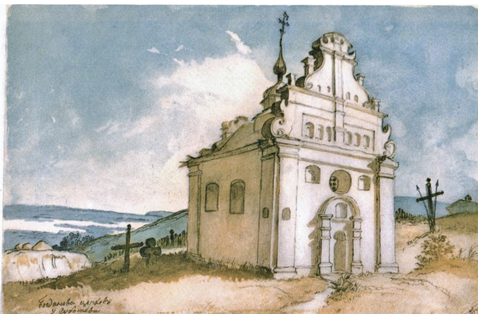
Рис.2. Т.Шевченко. Богданові руїни у Суботіві. 1845р. Папір, акварель

На думку більшості біографів, Т.Шевченко не мав змоги зупинитися на Чигиринщині надовго, через надто напружений ритм життя, тому працював швидко. Завдяки поїздці виникають неперевершені роботи художника, серед яких "Богданові руїни у Суботіві" (папір, акварель), 1845р., де ліворуч чорнилом є власноручний напис автора (рис.2).