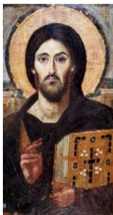
Рис. 4. Ікона Ісуса Христа з синайського монастиря св. Катерини. VI ст.

на шляхах містичного, літургійного і художнього гнозису. У цьому невербальному містичному пізнанні Бога вагома роль відводилась художнім образам. Псевдо Ареопagit розрізняв подібні і неподібні образи духовних істот. Хоча він надавав більшого значення останнім, зображення Бога через неподібні символічні образи (риби, хліба, виноградної лози та ін.) було для християнського мистецтва вже пройденим етапом. Подібні іконописні образи передбачали зображення людського вигляду Христа, одухотвореного присутністю божественного ества. Вони передають не тільки історичні портрети Христа, але, насамперед, втілюють Його божественну сутність як надсвітлової духовної субстанції. Характерним прикладом такого образу є енкаустика ікона «Христос Вседержитель», подарована в середині VI ст. імператором Юстиніаном Синайському монастирю святої Катерини (рис. 4).