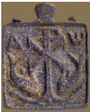
Рис. 1. Зображення риби та якоря на саркофазі з ватиканського пагорба. III ст.

Іоанна сказано: «Ось Агнецъ Божий, що бере на себе гріхи світу» (Ін.1: 29), пелікан, оскільки він рятує дітей своєю кров'ю і плоттю, виноградна лоза та хліб, оскільки Христос сам порівнював себе з ними: «Я – хліб життя» (Ін. 6:48), «Я виноградина правдива, а Отець Мій – виноградар. Я виноградина, ви гілки. Хто перебуває в Мені, і Я в ньому, той приносить багато плоду» (Ін. 15:1–5). Особливе значення мав символ риби. Грецьке слово «Ιχθύς» (риба) стало скороченням повного титулу «Ісус Христос Син Божий Спаситель». Одна з найбільш цікавих символічних композицій розміщена на плиті III ст. з ватиканського пагорба. Тут є зображення хреста, якоря, двох риб, хризми та літер «α» та «ω» – символів Бога, з волі Якого постав всесвіт і завершить своє існування. «Я є Альфа і Омега, початок і кінець, Перший і Останній» (Об. 22:13) (рис.1).