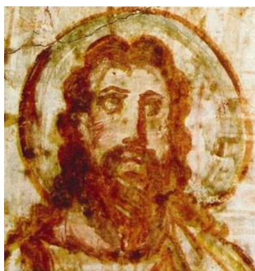
Рис. 3. Зображення Ісуса Христа в катакомбах Домітілли IV ст.

З античною традицією це зображення ріднить тільки те, що воно правдиво передає зовнішність Христа. А відрізняється воно тим, що в ньому передані характерні іконографічні