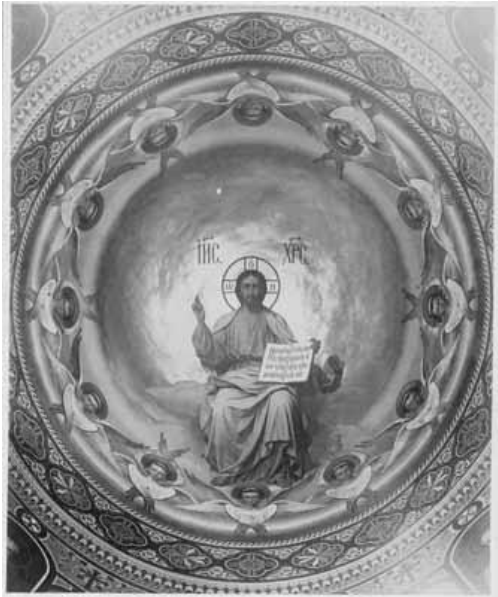
Рис. 4. В. П. Верещагін і художники. Христос Вседержитель. 1897–1900. Олія. Розписи Великої Печерської церкви. Фото поч. XX ст. НЗКПЛ

Окремо зауважимо, що розписи Успенського храму Лаври були популярними, на початку XX ст. з них були зроблені фотознімки. Серед архівних матеріалів чисельністю і різноманітністю відзначений корпус джерел з колекції НЗКПЛ, яка була утворена та збережена завдяки шанувальникам українського сакрального мистецтва, музейним працівникам, співробітникам наукових установ. Колекція складається з візуальних і текстових джерел: це фотознімки і скляні негативи, з яких робилися фото, фрагментів загального проекту розписів, підготовчих ескізів, настінних композицій, креслень; серед них є фототипії, зроблені у фотомайстерні та друкарні Києво-Печерської лаври; а також документи, пов'язані з проведенням живописних і ремонтних робіт, влаштуванням опалення і вентиляції тощо.