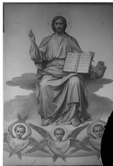
Рис. 3. В. П. Верещагін. Христос Вседержитель. Ескіз. 1894–1898. Негатив поч. ХХ ст. НЗКПЛ

храму (наприклад, КПЛ-Н-307, КПЛ-Ф-3960; рис. 3, 4).