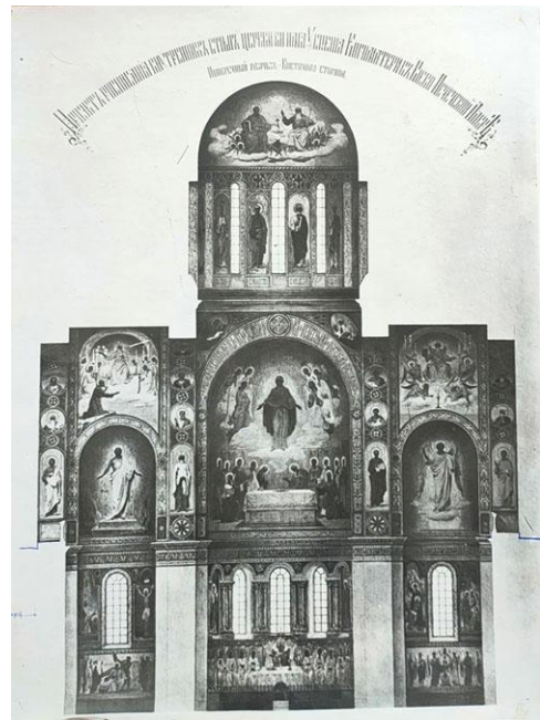
Рис. 5. С. М. Лазарєв-Станицев. Поперечний розріз східної стіни. Проект розпису Великої церкви Києво-Печерської лаври. Фрагмент. 1896. Фото поч. XX ст. НЗКПЛ

1637, рис. 5; КПЛ-Н-2146, КПЛ-Н-2195, 2244). «Проект..» представляє інтерес з точки зору трансформації сюжетних ліній та іконографії зображень. Первісний задум підтверджує відданість митрополита Іонникія лаврській художній традиції: так, у скуфії центрального купола планувалося залишити композицію «Новозавітна Трійця», на склепінні трансепта – композиції на тему Одкровення Іоанна Богослова, у жертovníку – сюжети Страсного циклу. Останні були втілені в розписах, а в куполі був зображений Христос Пантократор згідно з візантійським каноном храмової декорації XI–XII ст.