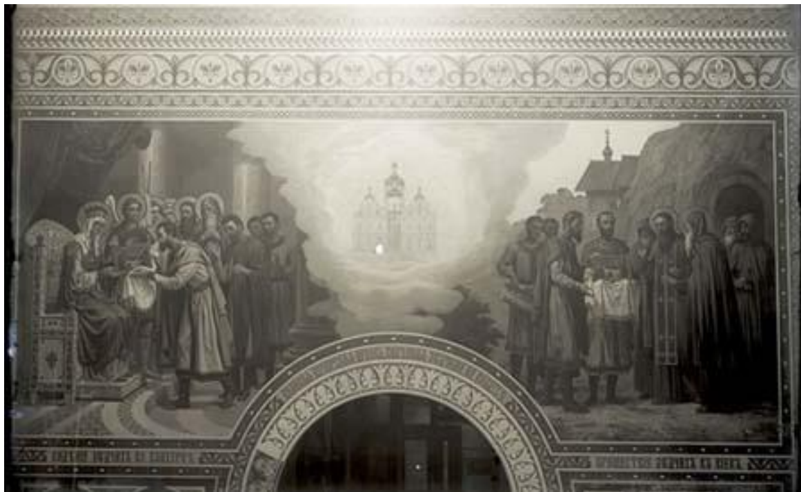
Рис. 2. В. П. Верещагін і художники. “Видіння зодчих во Влахернї. Великая Печерская церковь, видѣнная зодчими на воздухѣ. Пришествіе злѣдчихъ въ Кіевъ”. 1897–1900. Олія. Розписи Великої Печерської церкви. Негатив поч. ХХ ст. НЗКПЛ

композиції (КПЛ-Н-846; рис. 2). Вона ілюструвала оповідь Печерського Патерика про заснування Великої церкви [8, 158–161] і являла собою смисловий центр храмової декорації. Акцентування ідейно-тематичного центру системи розписів, використовуючи просторове розташування, виявляло професійність художника-монументаліста.