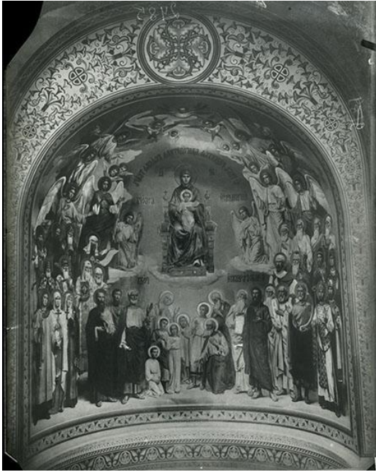
Рис. 6. В. П. Верещагін і художники. «О Тебѣ радуется...». 1897–1900. Олія. Розписи Великої Печерської церкви. Негатив поч. ХХ ст.

изъ рукъ въ руки всѣмъ присутствующимъ блюде съ раздробленною частью просфоры и круговая чаша меду, почерпнутаго изъ большой серебряной вызолоченной чаши, украшенной финифтевыми иконками» [9, 54–55]. В остаточному варіанті В. П. Верещагін виконав композицію, що прославляла Богородицю, – «Про Тебе радіє» («Похвала Богородиці») (КПЛ-Н-851; рис. 6).