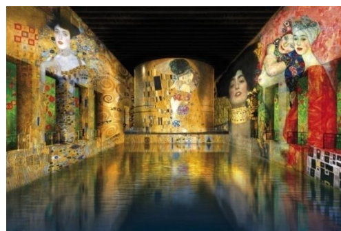
Рис.2. «Bassins de Lumières», 2021 р. Діджитал арт-центр у Парижі.

У 2012 році вперше французька компанія «Culturespaces» представила цифрові зображення та музику у рамках нової форми імерсивної виставки «Carrières de Lumières». Ця нова система презентації мистецтва для широкої аудиторії зробила «Culturespaces» провідним учасником цифрової трансформації. В 2018 році у Парижі відкрився цифровий арт-центр, розташований у просторі колишнього сталеливарного заводу – «L'Atelier des Lumières» (рис.1) [19], через два роки, у