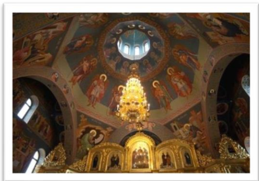
Рис. 3. Розпис підкупольного простору храму Покрова Пресвятої Богородиці, с. Бойове Донецької області [17]