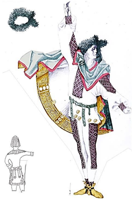
Рис. 11. Цугорка О. Ескіз костюма воїна Полян до балету «Володар Борисфену», Київ, 2010

українського декоративного мистецтва від його витоків до сучасності, творчість класиків українського та світового декоративного мистецтва минулого й сценографів сучасного театру. Важливим для нього є вміння «читати» сценографічний ескіз, розуміти просторове рішення декорації в макеті, форми та методи декоративних прийомів у кожній конкретній виставі.