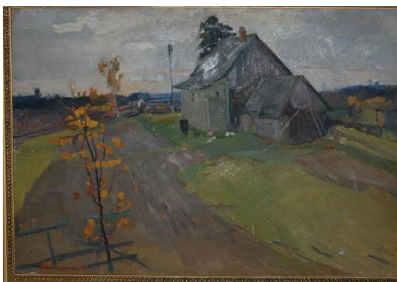
Рис. 3. Сірий день, к., о., 50x70, 1964 р. [1]