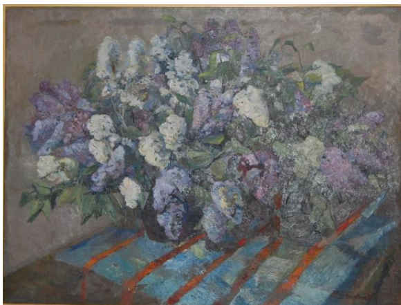
Рис. 1. Натюрморт. Бузок, п., о., 99x130, 1962 р. [6, 129]