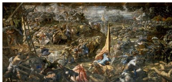
Рис. 4. Якопо Тінторетто. «Облога Задара»

Живописне зображення минулих епох якнайкраще корелюється із живописом у традиціях старих майстрів. Наприклад, у роботі «Галичани у хрестовому поході» (рис. 3) присутній вплив митців Пізнього Відродження, зокрема, Якопо Тінторетто (рис. 4). В обидвох роботах відчутний бароковий динамізм композиції, багатофігурність із зображенням складних ракурсів, тонка проробка найдрібніших деталей, приглушена колірна гама із поодинокими акцентами яскравих відтінків червоного, блакитного кольорів. Гладка манера письма мистців, розмежованих у часі кількома століттями, додає роботам враження деякої глянцевої. Більше того – навіть певного кінематографічного ефекту в спогляданні динамічних історичних батальних сцен.