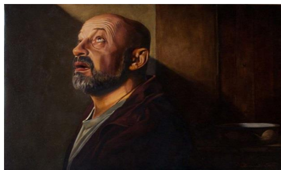
Рис. 5. Євген Равський. «Я вірую!»

Барокова емоційність, звернення до прийому к'яроскуро дозволяє провести паралель між художньою творчістю Караваджо та Є. Равського, Темне тло у картинах обох митців часто виступає як своєрідна непомітна, але вкрай важлива декорація людського характеру. При цьому, одяг та інші зображувані деталі буденності є вторинними – особистість, її переживання, емоції, закарбовані на обличчі, є важливими (рис. 5).