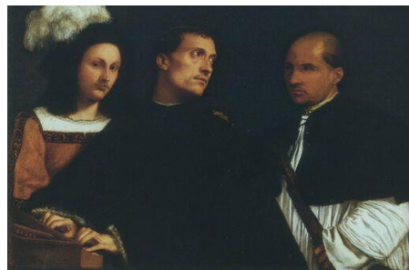
Рис. 2. Тиціан. «Концерт»

Преттеджон акцентує на наявності подібності композиції у творі А. Легро «Репетиція служби» (рис. 1) та творі Тиціана «Концерт» (рис. 2) та підкреслює, що на обох картинах фігури зображені біля клавіатури, яка розміщена в нижньому лівому кутку полотна [12].