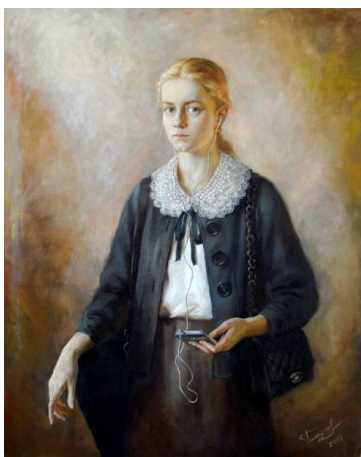
Рис. 6. Олексій Глазунов. «Художниця»

Висновки. Констатуємо, що звернення до художньої традиції старих майстрів не є новим підходом у мистецтві, проте в українському мистецтвознавстві відсутня достатня кількість фундаментальних наукових розвідок щодо впливу творчості старих майстрів на становлення сучасних українських художників.