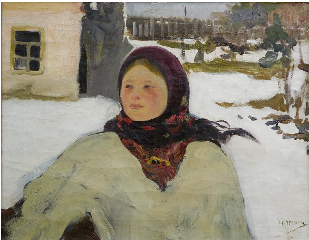
Рис. 3. Олександр Мурашко (1875–1919) Дівчина. Близько 1906 р. Полотно, олія, 64×82 см Збірка Дніпровського художнього музею