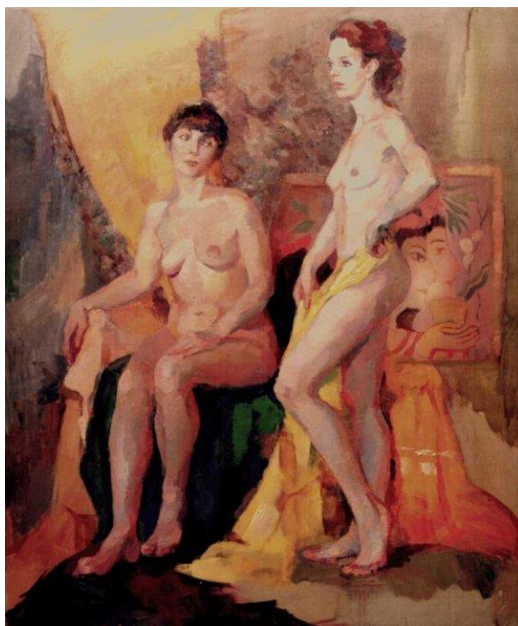
Рис. 2. Карпенко О. «Натурниці». Олія, полотно, 2001 р.

Наукова новизна. У поки що малочисельному корпусі наукових розвідок про творчість О. Карпенко як представниці київської школи живопису увагу вперше сфокусовано на реалістичному компоненті манери київської художниці, наявність якого дозволяє позиціонувати стиль майстрині як оповісника академізму, можливість говорити про збереження класичних традицій мистецтва живопису.