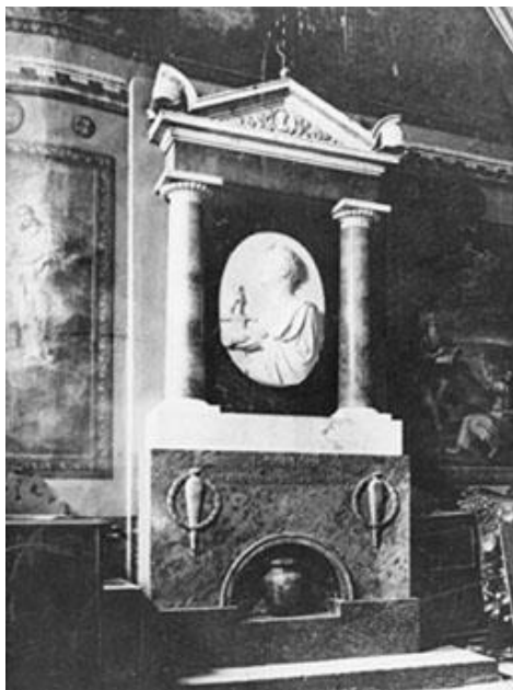
Рис. 2. Західна стіна приділа святого апостола і євангеліста Іоанна Богослова. Праворуч і ліворуч – розписи К. Волошинова. Фото початку ХХ ст.

Навіть за наявності вигляду тільки західної стіни приділа можна впевнено говорити про риси класицизму в його декорації. На відміну від барокової пишної живописності, бурхливого руху, складних ракурсів фігур, яскравого колориту ми, розглядаючи декорацію, створену К. Волошиновим, потрапляємо в інший художній світ. Світ, оснований на законах класицизму, де превалюють логіка, вираженість, спокійний ритм, архітектурні засади.