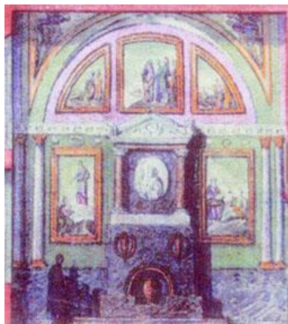
Рис. 1. К. Волошинов. Розписи західної стіни приділа святого апостола і євангеліста Іоанна Богослова. 1832. Олія. Фрагмент акварелі Ф. Солнцева західного розрізу Великої церкви. 1843

Федором Солнцевим акварелі розрізів Великої церкви (Успенського собору). В акварелі західного розрізу бачимо розписи нижнього бічного приділа святого апостола і євангеліста Іоанна Богослова (рис. 1). Розписи влітку 1832 р. виконав художник із Борисполя Корнилій Євстафійович Волошинов за малюнком, затвердженим київським митрополитом Євгенієм (Болховітіновим). Сюжети композицій були присвячені темі життя Іоанна Богослова [1, с. 102–103]. На архівному фото з колекції Національного заповідника «Києво-Печерська лавра» [2], яке публікується вперше, обабіч пам'ятника генерал-фельдмаршалу П. Рум'янцеву-Задунайському (автор – І. Мартос) видно фрагменти двох сюжетних композицій (рис. 2).