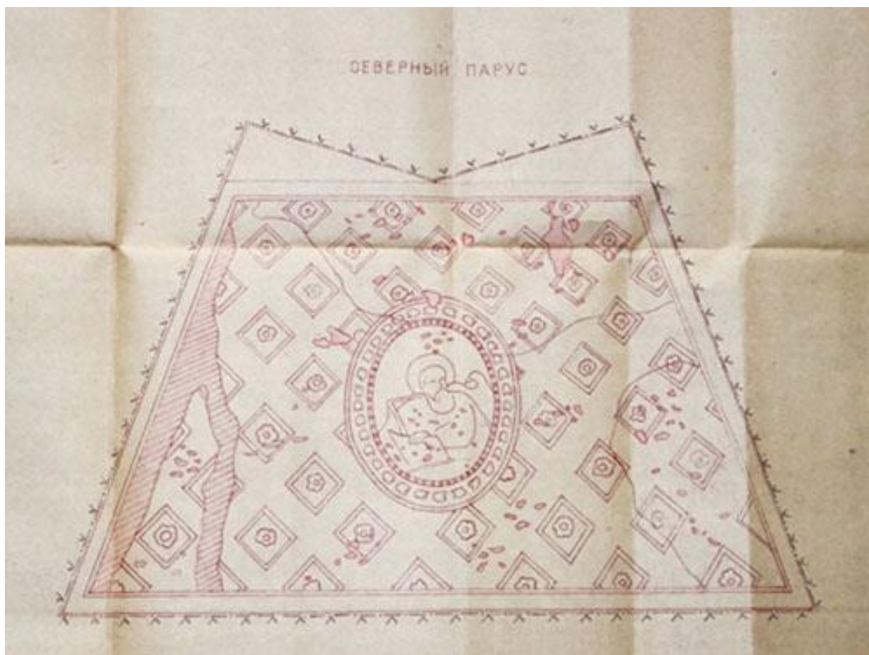
Рис. 5. Святий апостол і євангеліст Іоанн Богослов. Північний парус центрального купола церкви Різдва Пресвятої Богородиці. Картограма парусів центральної частини. Фрагмент. 1977

Центральна частина. По всьому периметру центральної частини, продовжуючись з притвору, тягнеться смуга розбивки під руст. Над композиціями «Преображення Господне», «Сходження Богоматері після преставлення на Небо» – антаблемент сірого кольору. На східному боці південного та північного стовпів арки, яка відділяє центральну частину від притвору, зображено по одній колоні сірого кольору на синьому фоні. Колони підтримують сірого кольору антаблемент, написаний на східному боці склепіння арки. У восьмикутному барабані центрального купола під вісьмома вікнами по сірому тлу білим кольором написані елементи декоративної скульптури: гірлянди квітів, тумби, херувими; у простінках між вікнами зображені спарені колони з капітелями. Віконні прорізи облямовані фільонками синьо-сірого кольору, укosi пофарбовані сірим кольором. Навколо композиції «Новозавітна Трійця» в центральному куполі зображений карниз. На стовпах передвітарної арки – дві симетрично