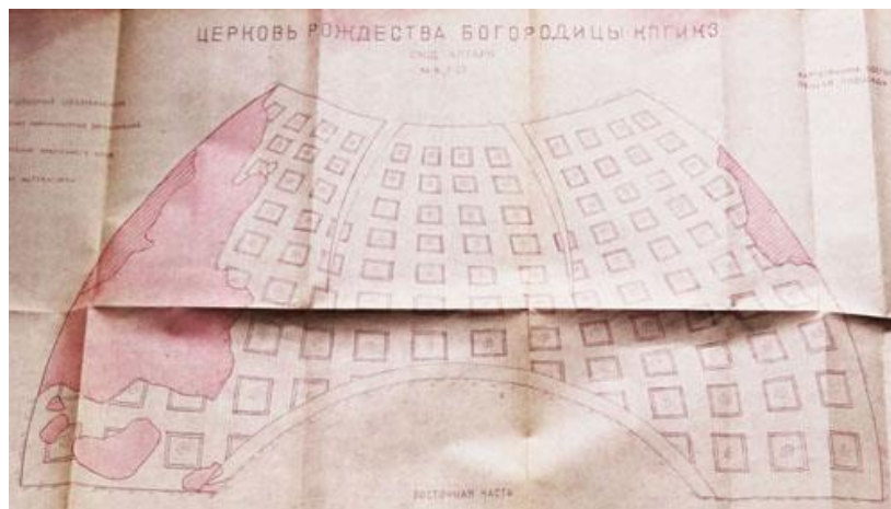
Рис. 3. Склепіння вітваря церкви Різдва Пресвятої Богородиці. Картограма. Фрагмент. 1977

Для аналізу стилю розписів інтер'єру церкви Різдва Богородиці фактичною основою є комплекс текстових і візуальних матеріалів «Проектних пропозицій...». Через роки хочеться висловити щиру подяку всім фахівцям, хто працював над цим дослідженням, завдяки якому вже зниклий живопис продовжує жити. До складу «Проектних пропозицій...», зокрема, увійшли: згадана історична довідка; опис композицій і стану збереження; методика, рецептура та технологія ведення реставрації; чорно-білі фотографії стінопису та картограми композицій тощо. Фото і картограми, описи композицій із зазначенням стану збереження (із значними пошкодженнями і великими втратами фарбового шару і тиньку) – ці архівні відомості ми вводимо в науковий обіг [6, арк. 11–27, 37–69].