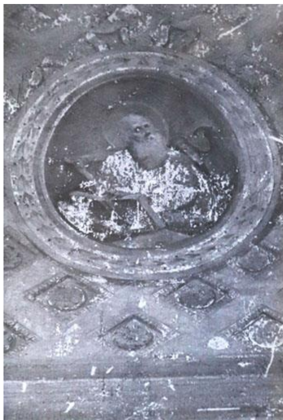
Рис. 4. Святий апостол і євангеліст Іоанн Богослов. Північний парус центрального купола церкви Різдва Пресвятої Богородиці. Живопис XIX ст. Олія. Фото. 1977

на київських горах» – у прямокутній рамі з дугоподібним завершенням [6, арк. 17].