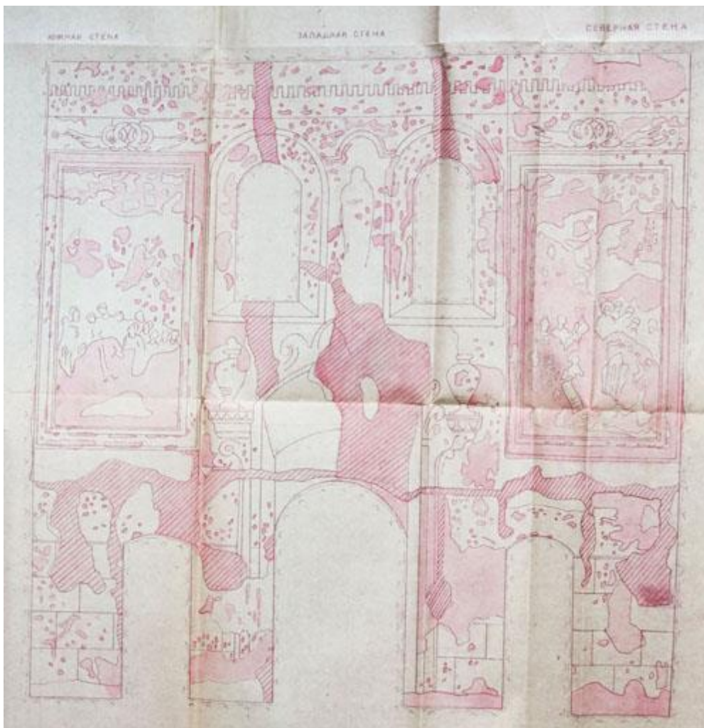
Рис. 6. Розгортка притвору церкви Різдва Пресвятої Богородиці. Картограма. 1977

Зображення святих і небесних сил, орнаменти й архітектурні елементи розташовувались строго симетрично, ритмічно повторювались, завдяки чому храмова декорація мала упорядковану структуру.