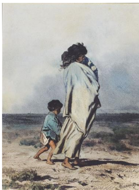
Рис. 1. Август фон Петтенкофен «Циганка з дітьми» (1854)

ромські образи – використання пейзажу як інструменту для розкриття психологізму портретованих, або ж атмосфери побутової сцени. Це дало змогу митцям продемонструвати дійсність у всіх її подробицях, оскільки пейзаж реалістичного напрямку уже був не таким помпезним, алегоричним та яскраво казковим, як, наприклад, за часів доби романтизму. За своєю колористичною гамою він був більш тьмяним – так би мовити, життєвим, максимально наближеним до повсякдення, із врахуванням кліматичного поясу, пори року, часу доби та особливостей ландшафту тієї місцевості, в яку художник «поселяє» ромський табір, самотню ромську фігуру чи груповий портрет.