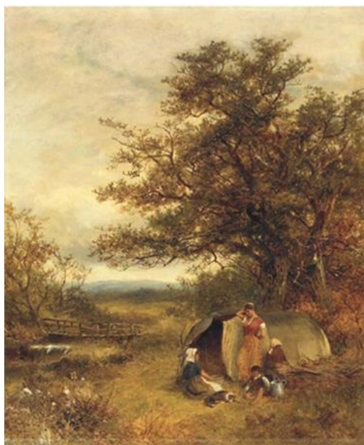
Рис. 4. Девід Бейтс «Циганський табір» (1886)

Полотно пейзажиста Девіда Бейтса (1840–1921) (рис. 4) «Циганський табір» (1886) вирізняється романтизованими нотами при створенні пейзажу, на тлі якого художник зобразив сцену відпочинку ромського табору. Крона масивного дерева возвеличується над мандрівним домом ромів – шатром, який у порівнянні з величиною оточуючої природи здається геть маленьким та потребує захисту в цієї природи. Соковиті коричнево-зелені кольори, досконале застосування прийому затінення й перспективи, масштаб неба й рослинності, а також те, що не роми зі своїм прихистком, а саме пейзаж є центром композиції, свідчать про захоплення художника пейзажним жанром і відчуттям єдності ромів з природою. У цій роботі Девід Бейтс зумів дуже делікатно передати те, що тогочасне ромське кочове життя асоціювалось саме з їхнім перебуванням на відкритому просторі, де картинки ландшафту щодня міняли одна одну. При цьому незмінним залишалось лише одне – прийняття ромами того факту, що вони є частиною цієї могутньої краси.