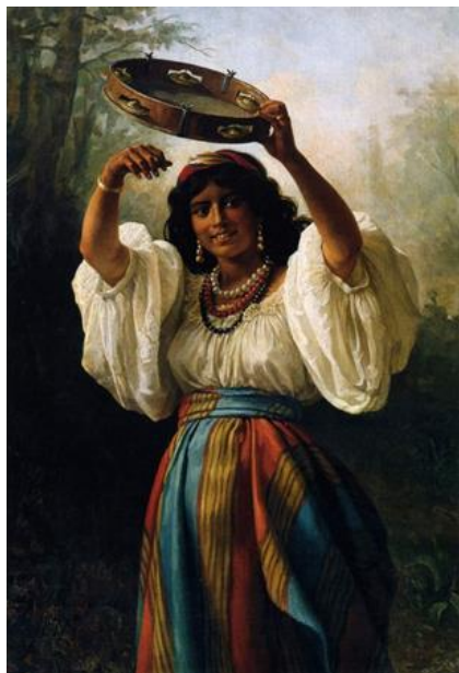
Рис. 2. Харитон Платонов «Циганка з бубоном» (1877)

відчуває ту холодну непривітну погоду і загалом, всю ситуацію, в якій опинилась ромська мати та її діти.