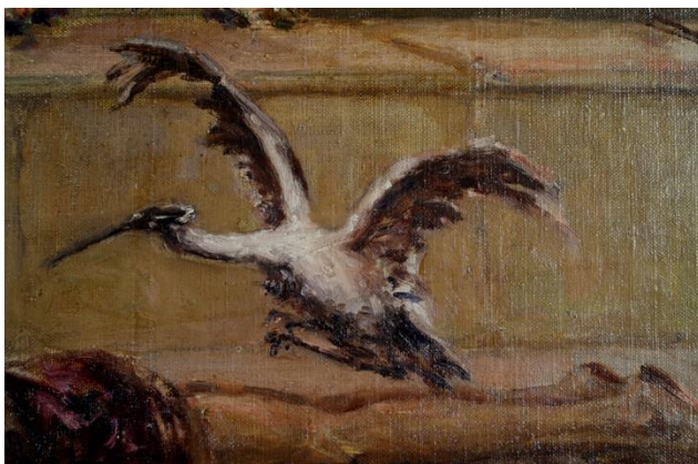
Іл. 1. Вільгельм Котарбінський. Годування ібісів (фрагмент)

Підготовчий рисунок. Фотофіксація в ІЧ-діапазоні дозволила виявити тонкі темні лінії підготовчих рисунків, що намічають контури деталей зображення. Мікроскопічні дослідження творів були ускладнені наявністю лакового покриття зі значною відбивною здатністю, що не дозволило ідентифікувати матеріал підготовчих рисунків. У наскрізному ІЧ-випромінюванні були виявлені незначні авторські правки композиційних елементів картин «Ранковий серпанок» (розташування руки та складок одягу) і «Годування ібісів» (розташування крил птаха, іл.1–2).