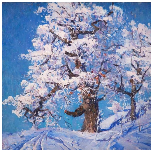
Рис. 1. Г. Г. Чернявський (1924–1981). «Дуб в інії». 1966 р. Полотно, олія, 70×70 см Збірка Дніпровського художнього музею

Переважну більшість робіт, виконаних у техніці олійного живопису (принаймні 13 з 24), можемо віднести до краєвидів саме цієї категорії.