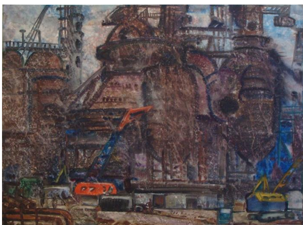
Рис. 3. Г. Г. Чернявський (1924–1981). «Силуети будівництва». 1974 р. Папір, акварель, 560×760 мм Збірка Дніпровського художнього музею

До третьої умовної групи можемо включити краєвиди урбаністичного змісту, які відображають пізнавані ландшафти як рідного для Георгія Георгійовича Дніпропетровська, так і місцин, якими мандрував художник. Мотиви такого спрямування віддзеркалені й у творах живопису, і в акварелі. Картини «Проспект К. Маркса в Дніпропетровську» (полотно, олія, 60×100 см; 1963) та «Дворик у Будапешті» (папір, акварель, 750×560 мм; 1972) (рис. 4) унаочнюють типові ознаки цієї групи краєвидів.