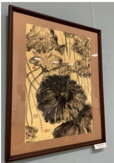
«Лотоси після дощу» М. Гуйда (2024)