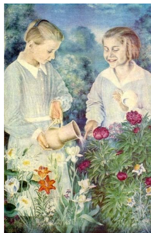
Рис. 2. Катерина Білокур, «Портрет племінниць», 1937–1939

Наприкінці ХХ століття художники поступово звільняються від соцреалістичних догм і канонів та розпочинають пошук своєї власної художньої мови. В. Зарецький у 1980–1990-х роках, під впливом творчості Г. Клімта, відроджує стилістику модерну, переосмислюючи її через призму українського мистецтва [2, 418]. У творах «Ніжність» (1987), «Спокуса. Портрет О. С. Килимник» (1984), «Портрет Раїси Недашківської у ролі Катерини Білокур» (1989), «Портрет Ганни Макаревич» (1989), «В стилі ретро» (1987) квіти стають структурним елементом композиції, формують ритм і визначають емоційний тон образу. В. Зарецький перетворює флористичні мотиви на самостійний художній код, поєднуючи естетику модерну з орнаментикою українського народного мистецтва.