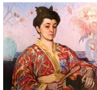
Рис. 1. Олекса Новаківський, «Жінка в кімоно», 1910

кімоно» (1910) (Рис.1) він поєднав мотиви європейської сецесії з японською стилістикою. Хризантеми натякають на популярний роман П'єра Лоті Madame Chrysanthe (1887) [9, с. 44], де квітка виступає символом привабливості, екзотичності та стриманих почуттів [14]. Тло з японським краєвидом у стилі кахьо-га, запозиченим від китайського хуа-няо («квіти і птахи»), створює ефект занурення в екзотичний сад – простір гармонії й духовності [9, с. 55].