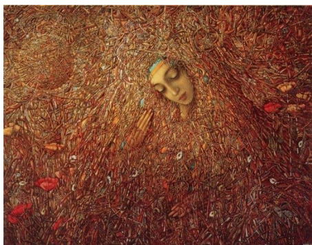
Рис. 4. Іван Марчук, «Пробудження», 1992

Після прийняття незалежності 1991 року, під впливом соціокультурних чинників, флористичний символізм набуває нових значень. Роль жінки в суспільстві змінюється і набуває спочатку дещо ідеалістичних рис [8,146]. Сучасні художниці переосмислюють квіткову символіку крізь призму особистісного, феміністичного та національного досвіду.