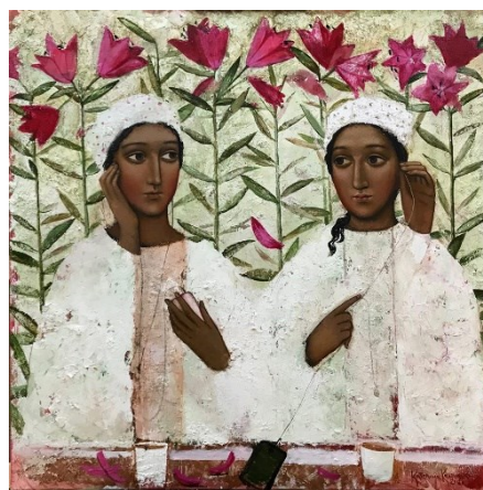
Рис. 5. Катерина Косьяненко, «Квіти та музика», 2018

К. Косьяненко у серії «Тетта» використовує традиційні християнські символи лілеї та троянди, підкреслюючи іконографічність жіночих образів («Квіти та музика» (2018) (рис. 5), «Станція «Дніпро»). Поєднуючи ці квіткові мотиви з образами сучасних жінок, художниця створює континуум між сакральним і сучасним, вказуючи на спадкоємність духовних сенсів та їх актуальність у сьогоденному культурному контексті.