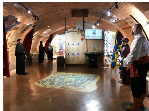
Рис. 2. Фігури історичних особистостей у музеї «Львів стародавній» [9]