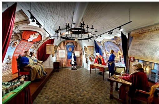
Рис. 3. Фігури історичних особистостей у музеї «Львів стародавній» [9]