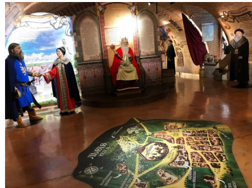
Рис. 1. Фігури історичних особистостей у музеї «Львів стародавній» [9]

зовнішній вигляд видатних постатей реконструйовано відповідно до археологічних знахідок та історичних джерел (рис. 1–3). Для максимального занурення у представлені епохи всі 12 експозицій створені у форматі 3D з додатковим застосуванням 5D-ефектів. Також у музеї наявний доступний зі смартфону аудіогід дев'ятьма мовами і є можливість для людей з вадами зору пройти всі експозиції з супроводом фахівця, оскільки замовити екскурсію, де представники цієї категорії населення можуть ще й почути звуки, відчутти запахи епохи, доторкнутись до предметів (війтівських ключів від чотирьох башт середньовічного Львова, реплік зброї, історичного одягу, монет тощо) можна задалегідь [21, 13].