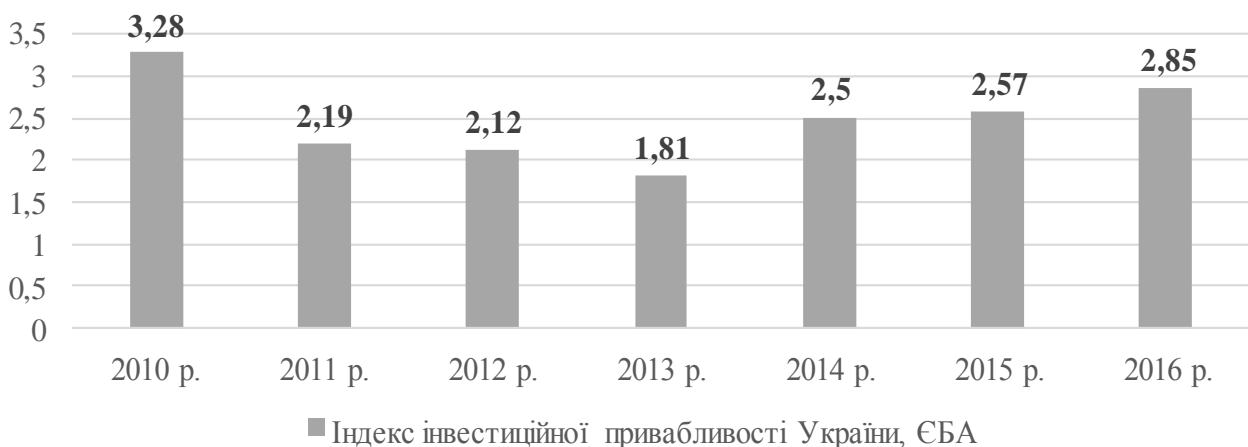
Рис. 2. Динаміка індексу інвестиційної привабливості України, розрахованого ЄБА [6]

Істотний вплив зазначених проблем на інвестиційну привабливість підтверджують дані індексів інвестиційної привабливості, розраховані міжнародними організаціями. Зокрема, за розрахунками Європейської Бізнес Асоціації, Індекс інвестиційної привабливості, який ґрунтується на характеристичі інвестиційного клімату як сукупності політичних, економічних, законодавчих, регуляторних та інших чинників, що в кінцевому рахунку визначають ступінь ризику капіталовкладень та можливість їх ефективного використання, у 2016 р. склав 2,85 балів із 5 можливих і перебуває в негативній зоні (рис. 1). Так, у звітному році 67% європейських бізнесменів були не задоволені інвестиційним кліматом в Україні і серед основних проблем у ключових для бізнесу сфер відзначають: корупцію (75% опитаних керівників); відсутність ознак судової (74%) і земельної (63%) реформи; фінансову стабільність (60%); відсутність поліпшення митних процедур (49%); негативні тенденції у відшкодуванні ПДВ (44%) [6]. Більше того, 42% респондентів зазначили, що у 2017 р. інвестиційний клімат в Україні все ще залишатиметься несприятливим.