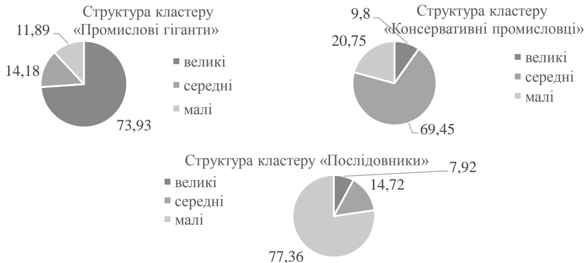
Рис. 1. Структура кластерів за розмірами підприємств (розроблено автором)

Кожний кластер характеризується специфічною структурою підприємств за розмірами (рис. 1), який буде відображати особливості функціонування Центру субконтрактації.