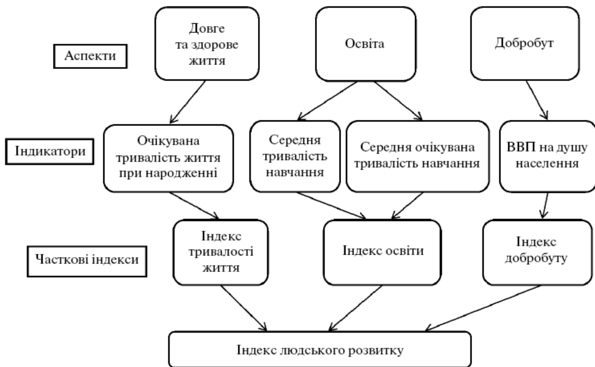
Рис. 2. Загальна схема побудови Індексу людського розвитку за методикою ООН [14]

Інтегральний регіональний індекс людського розвитку в Україні за складовими блоками у 2016 році дозволяє виявити місце кожного регіону в соціально-економічному розвитку країни. Так, Одеська область за результатами показників усіх блоків посідає 15 місце в рейтингу регіонів України.