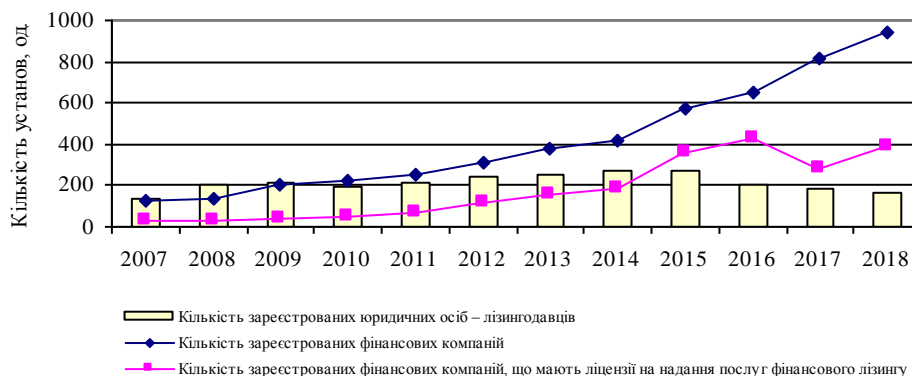
Рис. 1. Динаміка кількості фінансових установ та юридичних осіб – лізингодавців (побудовано за даними [10])

На тлі стрімкого зростання кількості фінансових установ в Україні, спостерігається тенденція до збільшення кількості компаній, які надають послуги фінансового лізингу, що свідчить про зростання попиту на такий вид фінансових послуг. Динаміка кількості установ свідчить про те, що з 2015 р. кількість зареєстрованих фінансових установ, які мали ліцензії на надання послуг фінансового лізингу, перевищила кількість юридичних осіб – лізингодавців. Це пояснюється зростанням конкурентоспроможності лізингу порівняно з традиційним банківським кредитуванням (рис. 1).