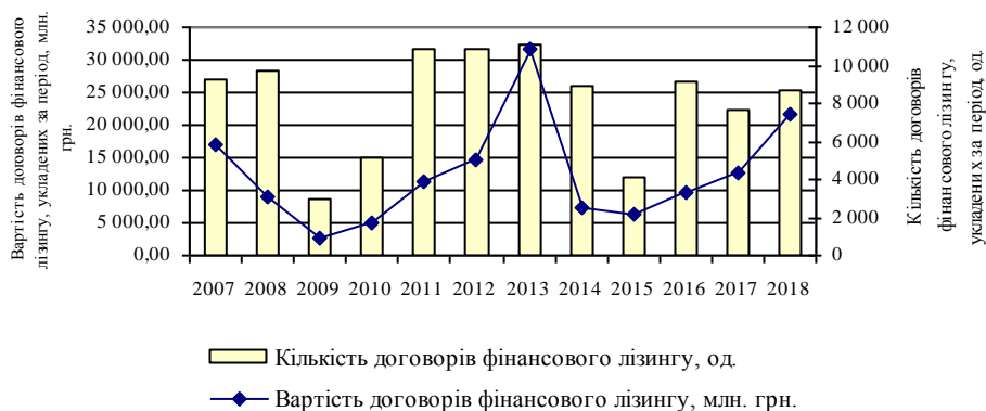
Рис. 2. Динаміка вартості та кількості договорів фінансового лізингу, укладених юридичними особами – лізингодавцями (побудовано авторами за даними [10])