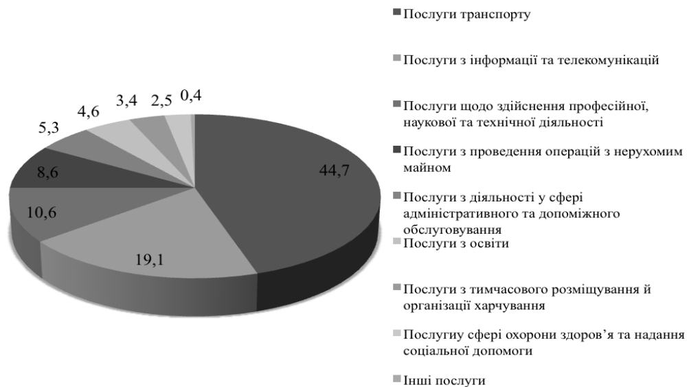
Рис. 2. Структура обсягу реалізованих послуг за видами в Україні у 2015 році, % (сформовано авторами за даними [9])

загального обсягу реалізації послуг в Україні). Сфера транспортних послуг є однією із найбільш розвинених сфер послуг в країні. Дана тенденція, перш за все, зумовлюється географічним розташуванням країни, займаною площею та кількістю населення. Послуги з інформації та телекомунікації займають 19,1% у структурі реалізованих послуг. Тобто можна зробити висновки про орієнтацію сфери послуг в Україні на надання традиційних послуг.