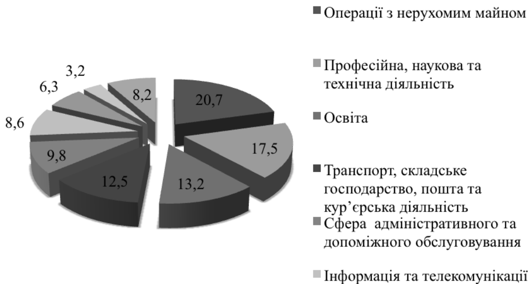
Рис. 1. Структура кількості підприємств сфери послуг в Україні у 2015 році за видами послуг, % (сформовано авторами за даними [9])

Розподіл кількості підприємств сфери послуг в Україні за напрямками надання послуг представлений на рис. 1.