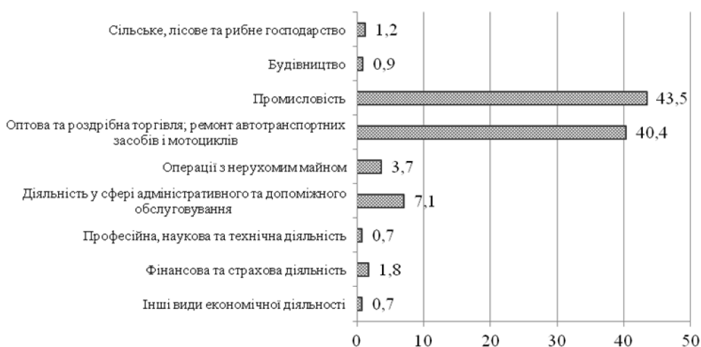
Рис. 3. Структура прямих іноземних інвестицій, % [8]

Сьогодні українська економіка потребує повномасштабної системної модернізації, що включає оновлення інфраструктури, зміну структури промисловості, експорту, внутрішнього ринку. Аналіз сучасного стану промисловості та державної допомоги виявив суттєве скорочення частки промисловості у ВВП, відсутність чіткої стратегії розвитку промисловості й неефективність існуючої державної підтримки. Створення сприятливого інвестиційного клімату, зорієнтованість на внутрішнє інвестування та активна інвестиційна позиція держави – це чинники формування ефективної структури економіки України. На сьогоднішній день більшість інвесторів надають перевагу більш вигідним, ніж виробниче інвестування, сферам вкладання капіталу – банківським операціям, купівлі цінних паперів, нерухомості, торгівлі споживчими товарами тощо. Відсутність державних гарантій та недостатній рівень страхування інвестицій підвищують інвестиційні ризики, що, паралельно з високою вартістю кредитних ресурсів в Україні, негативно впливають на інвестиційну активність. Для оптимізації структури залучення галузевого капіталу, потрібно розробити галузеву програму розвитку, залучити до її виконання вітчизняних та іноземних інвесторів. Інвестиційна привабливість галузі формується під впливом чинників: її інвестиційного потенціалу та ризику вкладення коштів у підприємства галузі [9, с.89].