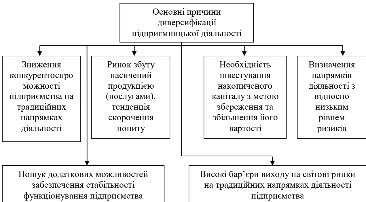
Рис. 1. Основні причини диверсифікації підприємницької діяльності (розроблено автором на основі [12])

На рис. 1 наведено перелік основних причин диверсифікації підприємницької діяльності.