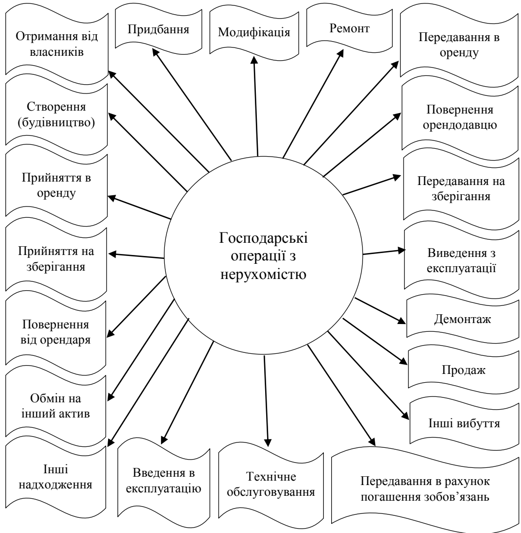
Рис. 1. Основні господарські операції з нерухомістю

спрямованих на їх реалізацію, отримання та оцінювання інформації стосовно наслідків виконання господарських операцій, а також – регулювання дій відповідальних осіб.