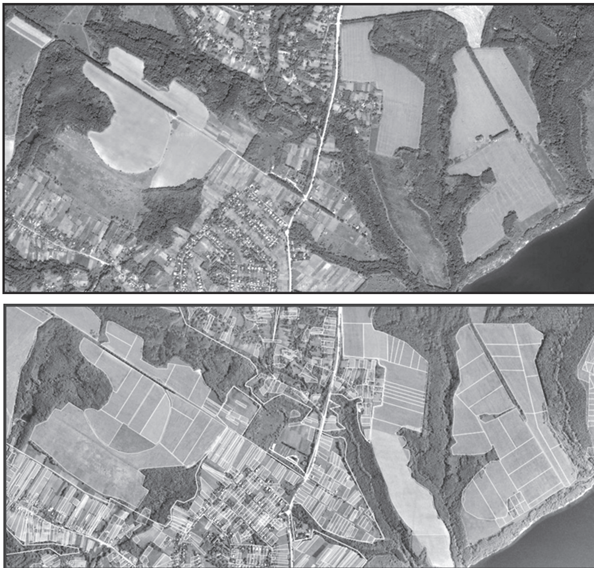
Рис. 1. Фрагмент шарів: природних об'єктів і земельних ділянок (меж) поблизу с. Бобріця Канівського району Черкаської області

право користуватися природними об'єктами права власності народу відповідно до закону» [2], на який (закон) влада поки що не спромоглася. Ця конституційна норма є обов'язковою й тому, що господарська діяльність, пов'язана з використанням природних об'єктів права власності Українського народу, може здійснюватися лише в процесі користування (неволодіння і нерозпорядження) ними на платній основі за встановленими регламентами.