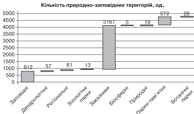
Рис. 2. Кількість природно-заповідних територій України, од.

родного середовища, вона повинна являти собою сукупність можливих та існуючих засобів, які допоможуть раціонально використовувати, охороняти та відтворювати природні ресурси [10, с. 6].